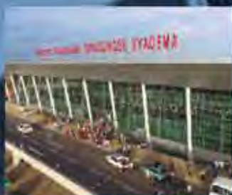
Aéroport International GNANASSINGBE Eyaadema