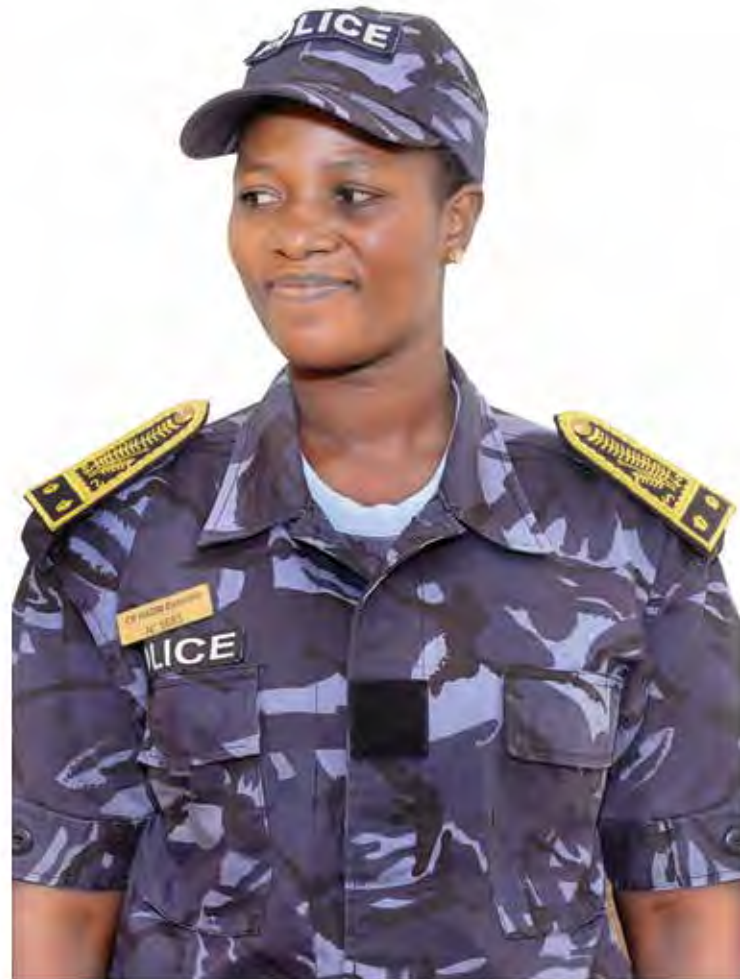
Commissaire de police, adjointe au chargé du commissariat spécial de police de l'A I G E

E.H. : Oui. À tous ceux qui choisissent l'Aéroport International Gnassingbé Eyadema pour voyager ou pour mener des activités, activités légales bien sûr ! j'exprime mes remerciements pour la confiance. Je voudrais vous dire combien vous êtes importants dans la chaîne de protection de l'aéroport, et combien votre collaboration est utile pour la réussite de notre mission ; celle de vous protéger contre les actes illicites. Je voudrais vous assurer qu'en appliquant des contrôles à l'aéroport, notre but n'est pas de vous retarder. Bien au contraire, nous travaillons toujours dans un souci d'efficacité et d'accélération du processus de traitement des